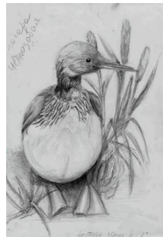
Б. Юля, 15 лет