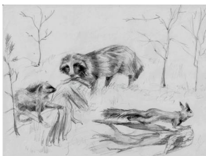
С. Вика, 15 лет