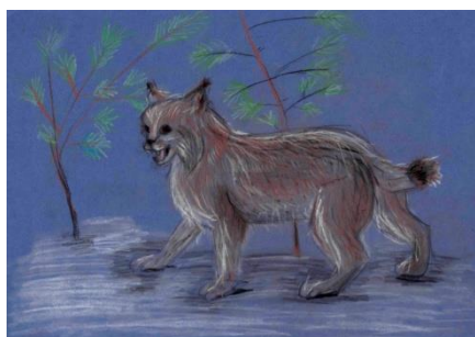
В. Варя, 13 лет