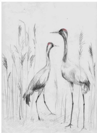
С. Вика, 15 лет