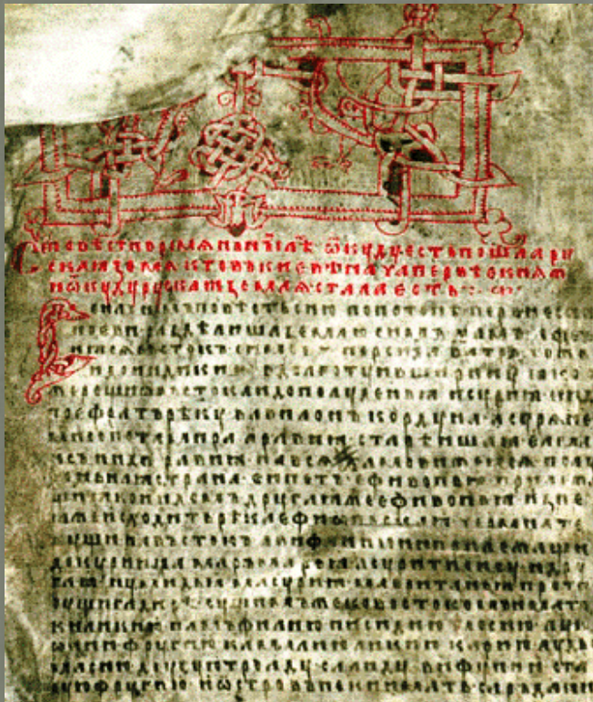
Страница Ипатьевской летописи

Летописи – рукописные русские исторические повествования, рассказывающие о событиях в жизни страны по годам; каждый рассказ начинался словом: «Лето...(год...)», отсюда и название – летопись. Русское летописание возникло в XI в. и просуществовало до XVII в.