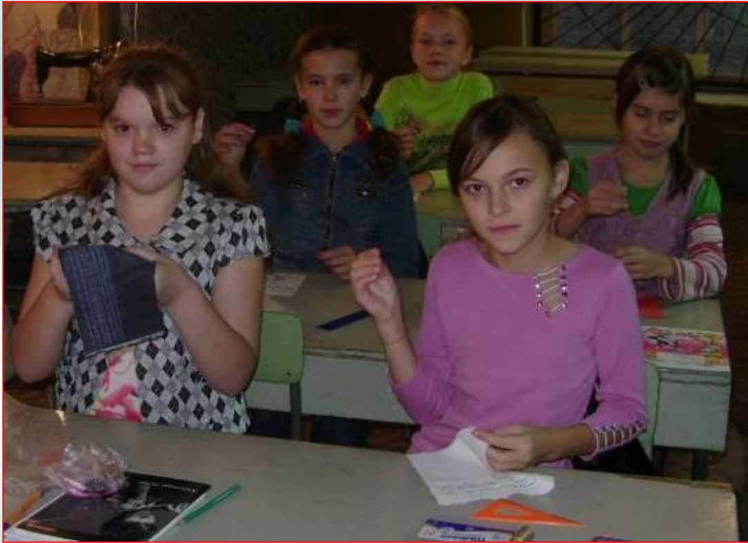
На уроках швеи с огоньком творят В будущем, быть может, мир модельный покорят