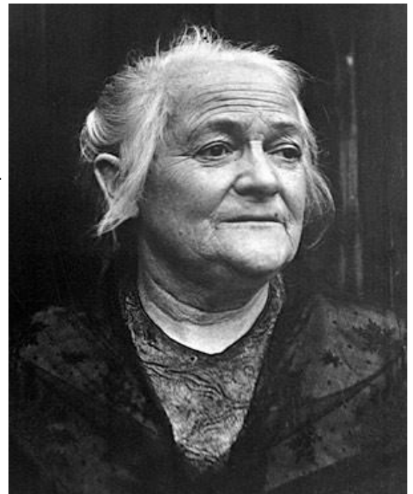
Clara Zetkin um 1920

https://www.kindersache.de/bereiche/wissen/politik/der-8-maerz-ist-frauentag